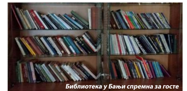
Библиотека у Бањи спремна за госте

Како би ноћу Одмаралиште изгледало што лепше, а прилаз био безбеднији, урађена је нова спољна расвета, као и расвета у вењаку. Захваљујући Сектору безбедности постављене су још две видео камере и тиме је сигурност гостију подигнута на виши ниво. На паркингу су засађене саднице, како би у наредним годинама „моторни љубимци“ гостију имали хладовину током сунчаних дана.