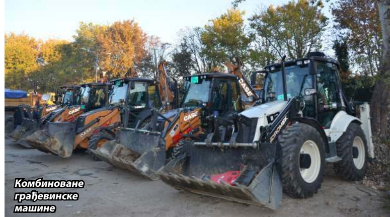
Комбиноване грађевинске машине