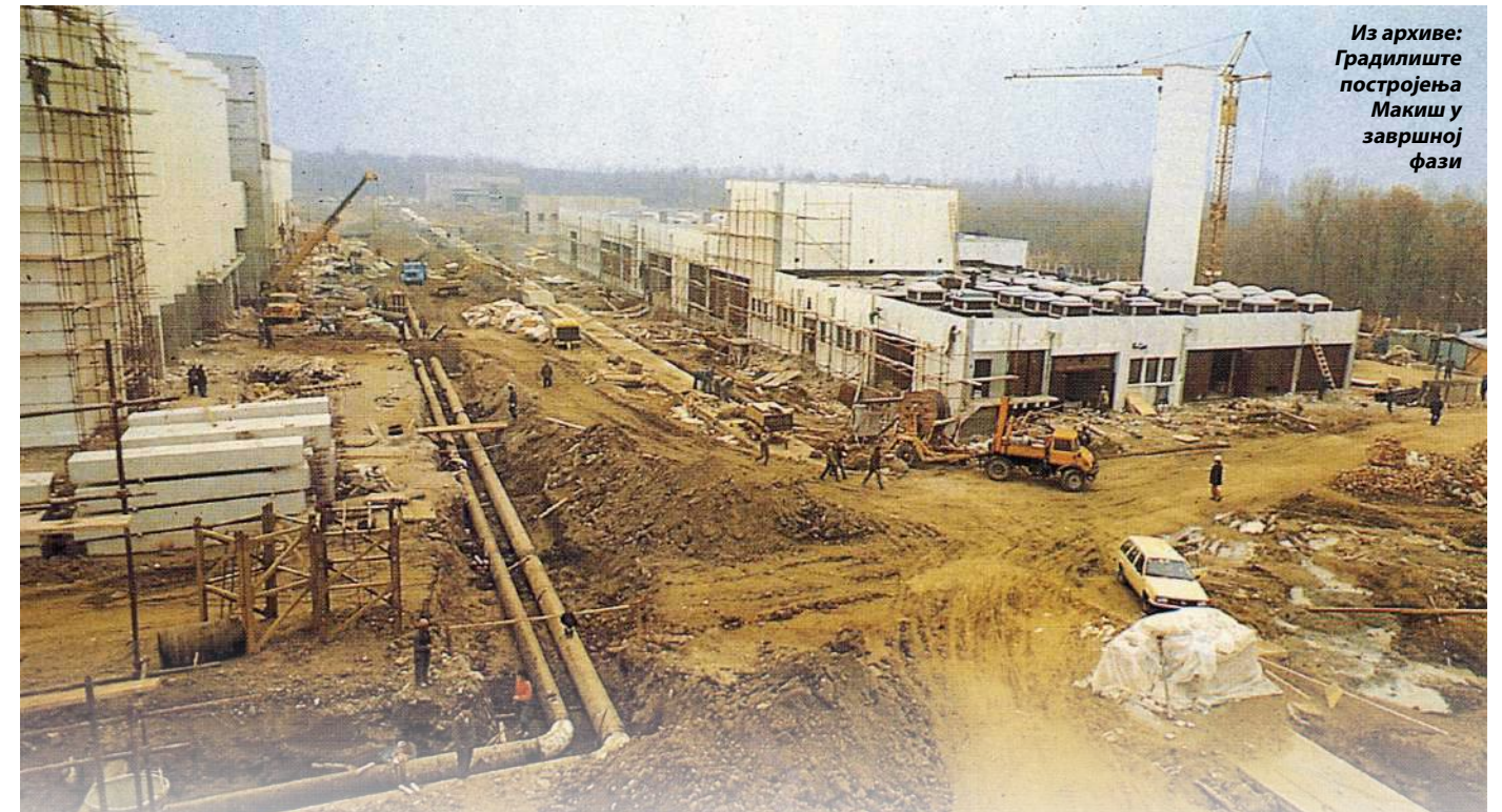
Из архиве: Градилиште постројења Макиш у завршној фази

Ново комбиновано специјално возило са усисним и потисним дејством недавно је стигло из италијанске фабрике „Моро“. Примера ради, посада возила са оваквом машином успе да по једној смени испере око 200 метара цеви или да очисти и до 40 кишних сливника.