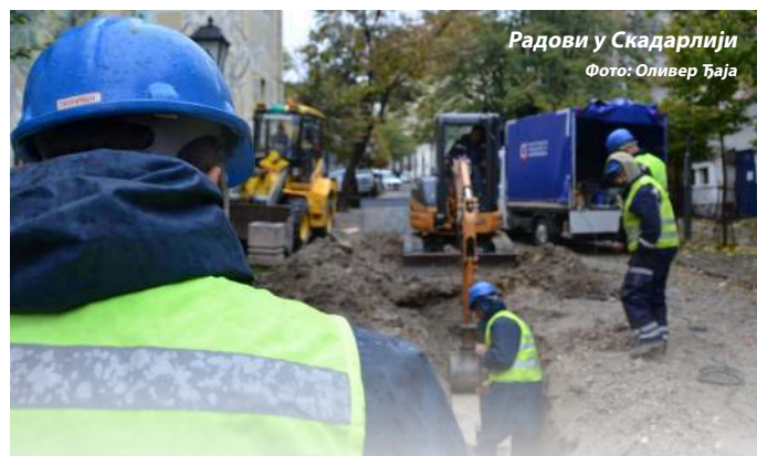
Радови у Скадарлији

У Дому здравља Врачар у периоду од 25.09. до 06.11. и ове године је Служба за безбедност и здравље на раду организовала периодичне лекарске прегледе 1200 радника, који су распоређени на радним местима са повећаним ризиком. Предузеће је по закону у обавези да запослене који раде на ризичним местима упути на лекарске прегледе, а са друге стране запослени су у обавези да их и обаве. За избегавање лекарских прегледа запослени носе одговарајуће последице.