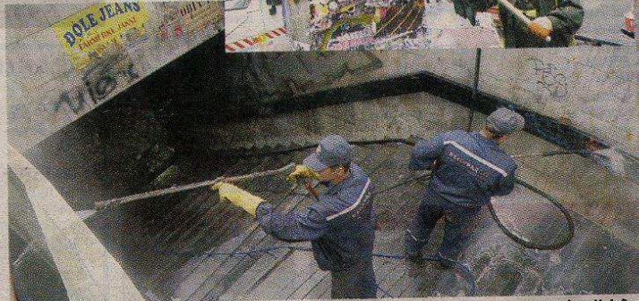
ПОСАО Радници Београд пута чисте пролаз код Теразија

Главаш, директор "Беоком сервиса". - Када то завршимо, прелазимо на подземне ходнике код ресторана "Франш", Аутокоманде, а након тога чистићемо пролазе код Београдског сајма и тржног центра "Ушће".