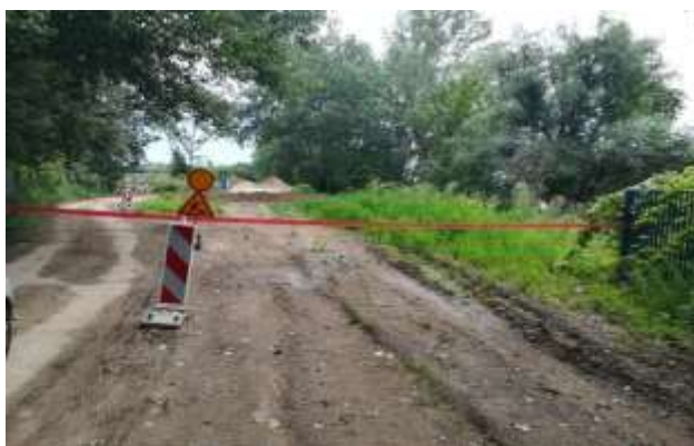
Slika 7 Zatvoren prolaz za motorna vozila (jul-oktobar 2018.)

Do sada nije bilo ni usmenih ni pismenih žalbi u vezi pomenutih radova.