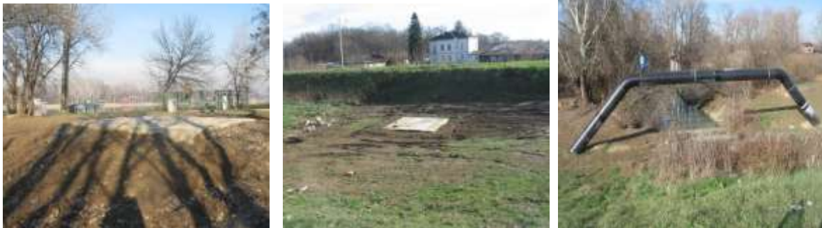
Slika 5 Nova biciklistička staza po završetku radova (maj 2017.)