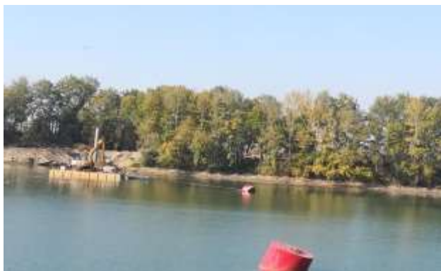
Slika 6 Radovi na gradilištu (oktobar 2018.)

Zbog navedenih radova, sugrađani su prvobitni obavješteni, da će u periodu od 25.06.2018. do 10.10.2018. godine biti onemogućen prolaz motornim vozilima između malog jezera „Taložnica“ i objekta vodozahvata JKP BVK (crpna stanica „Sava“). Rok za izvođenje radova je produžen, tako da će prolaz na pomenutoj lokaciji biti neprohodan do 30.11.2018. godine.