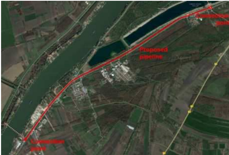
Slika 2. Bliži pogled na lokaciju na kojoj se nalaze kafići i restorani na trasi budućeg cevovoda

(Ugostiteljski objekti na trasi cevovoda: "Sunset", "Koketa", "Red Shoes" i "Time Out")