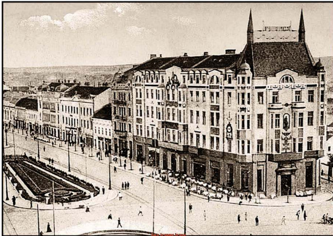
ТЕРАЗИЈЕ - снимљено 1912. године