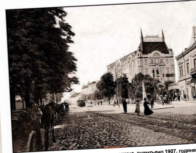
ТЕРАЗИЈЕ - Поглед из правца Коларчеве улице, снимљено 1907. године