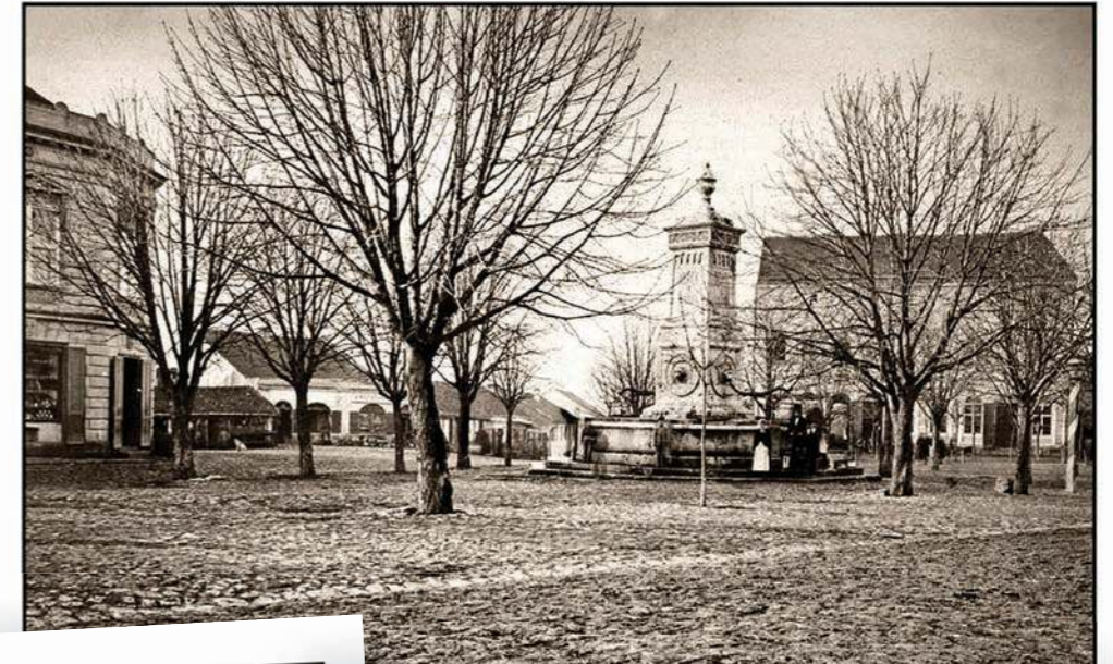
ТЕРАЗИЈСКА ЧЕСМА - Кафана Велика Србија и хотел Балкан, снимљено 1876. године

Уз тридесетак знаних и стотинак забитих јавних чесама широм престонице, најпознатија је она која није чесма већ фонтана. Упркос томе, колико се зна, Београђани и њихови гости пију најквалитетнију воду у Европи. Кад могу