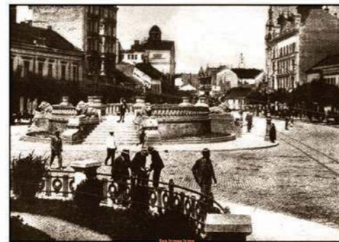
ТЕРАЗИЈЕ - Фонтана и рундела, снимљено 1925. године