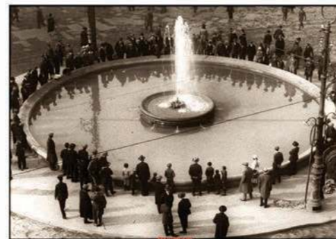
ТЕРАЗИЈЕ - Фонтана, снимљено 1928. године