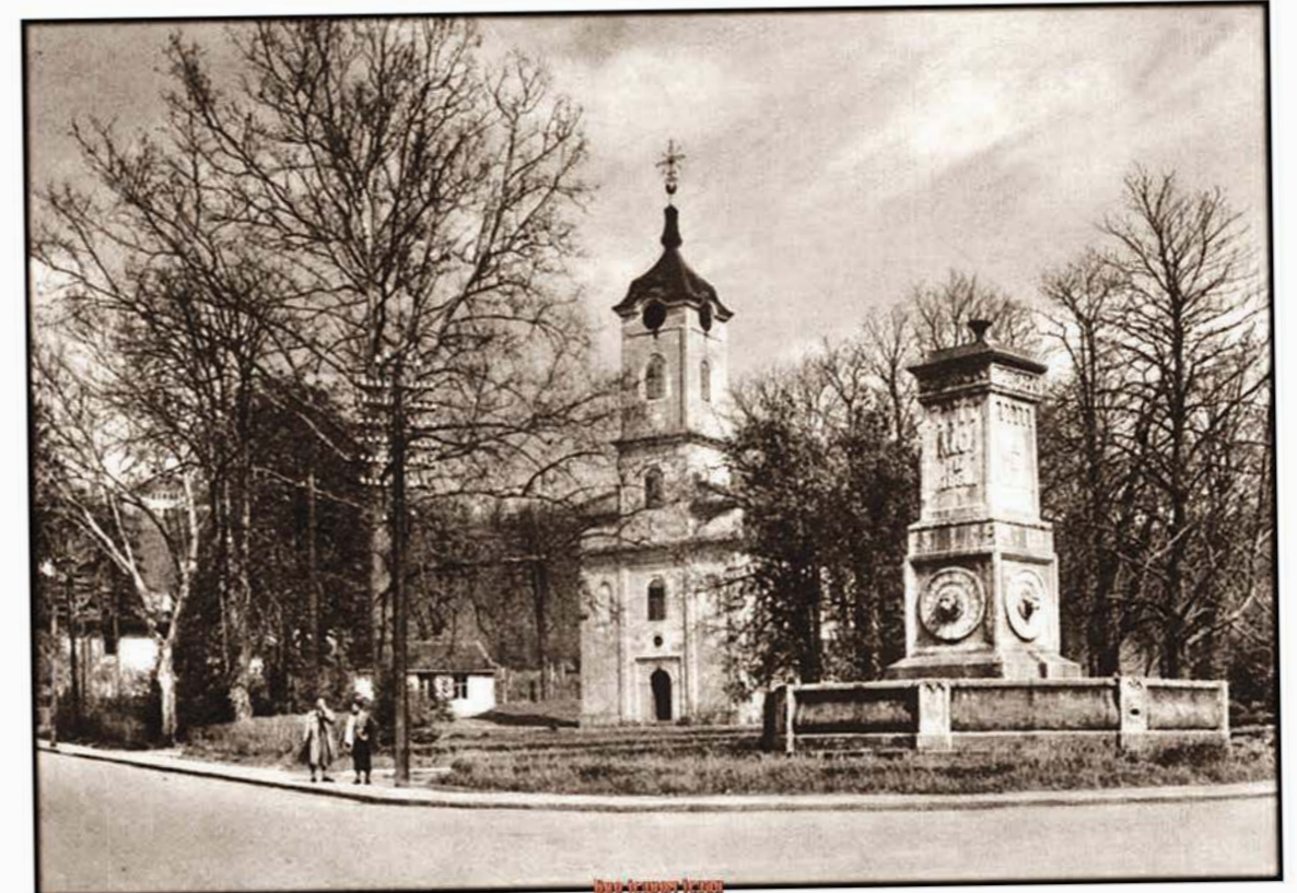
Топчидерска црква и Теразијска чесма, снимљено 1930. године