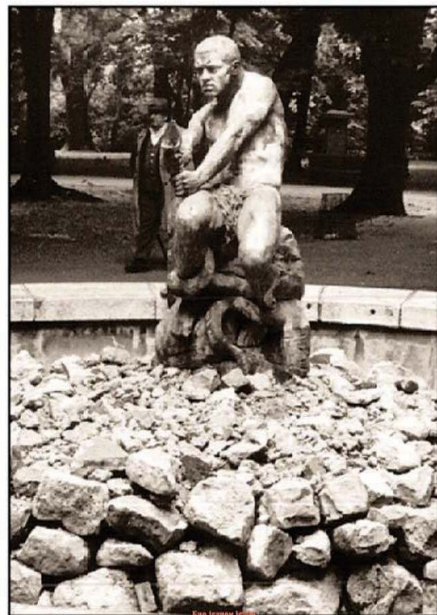
КАЛЕМЕГДАН - Скулптура „Рибар“, снимљено 1907. године