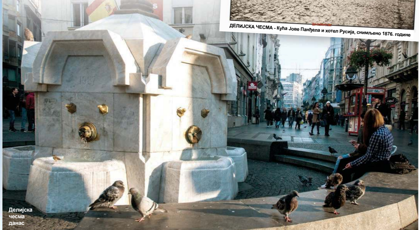
Делијска чесма данас