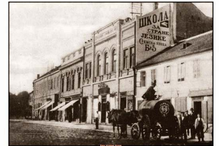
ТЕРАЗИЈЕ - Кафана Златни крст и сакација, снимљено 1908. године

варош што је ницала ка Ташмајдану и Фишегџијској махали, Абаџијском чаршијом према Западном Врачару, или ка рекама, ка Савамали и Дорћолу.