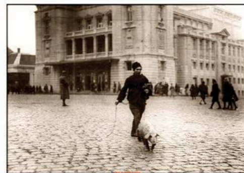
НАРОДНО ПОЗОРИШТЕ - Мали свињар, снимљено 1930. године