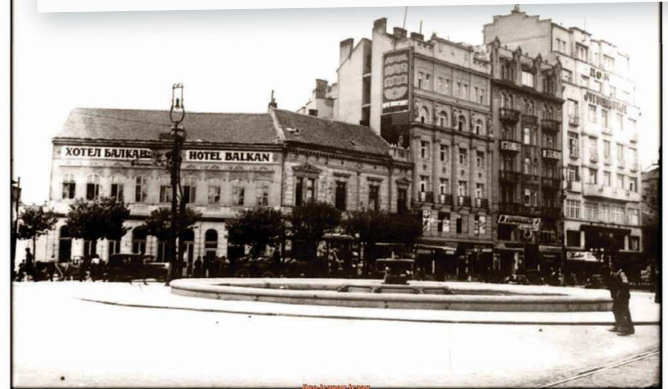
ТЕРАЗИЈЕ - Хотел Балкан, снимљено 1930. године