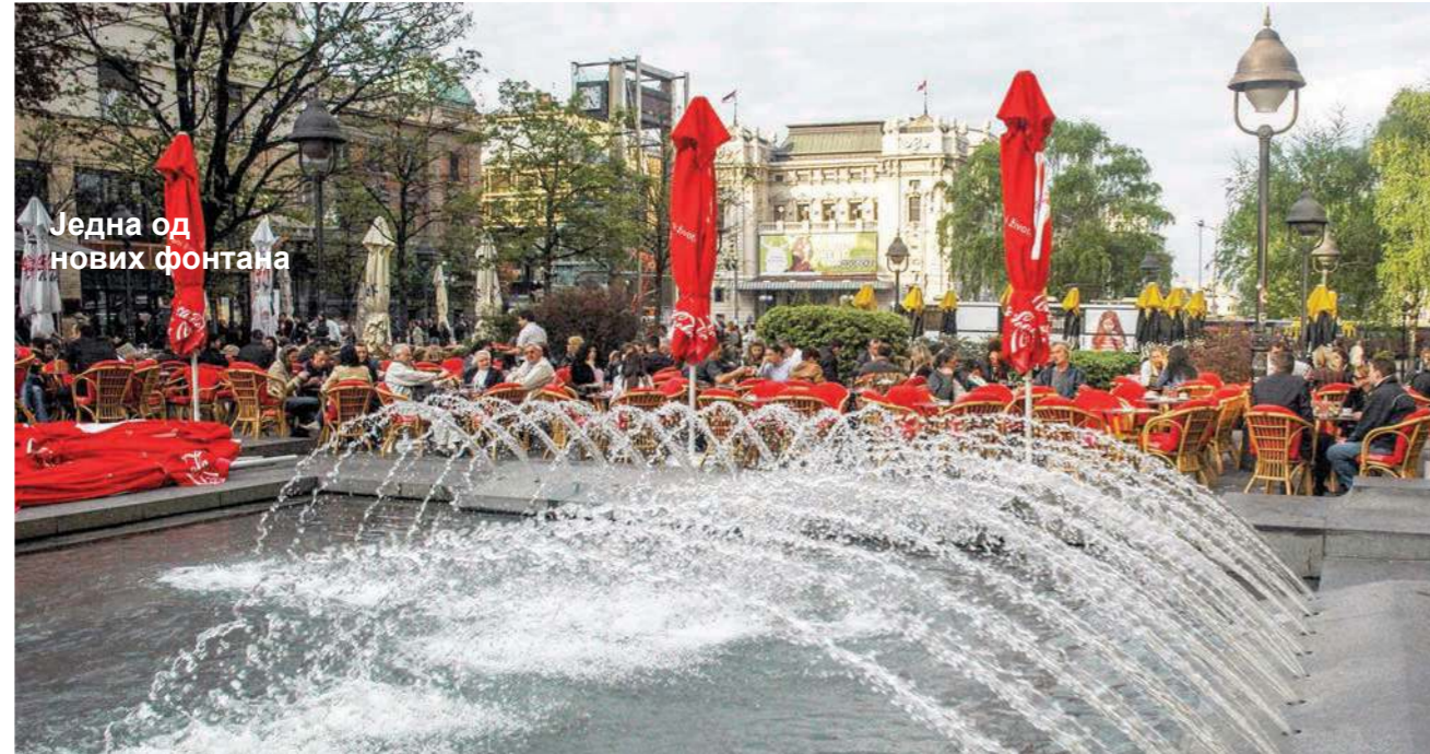
Једна од нових фонтана

■ Остаће вечита тајна зашто је модернизација Београда подразумевала и уклањање старих јавних чесми и бунара, јер да смо имали довољно мудрости били би сачувани „под стакленим звоном“ као сведоци повести за будуће нараштаје