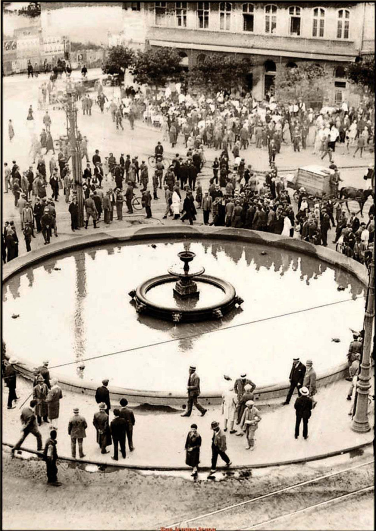
ТЕРАЗИЈЕ - Фонтана, снимљено 1927. године