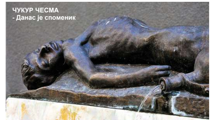
ЧУКУР ЧЕСМА - Данас је споменик