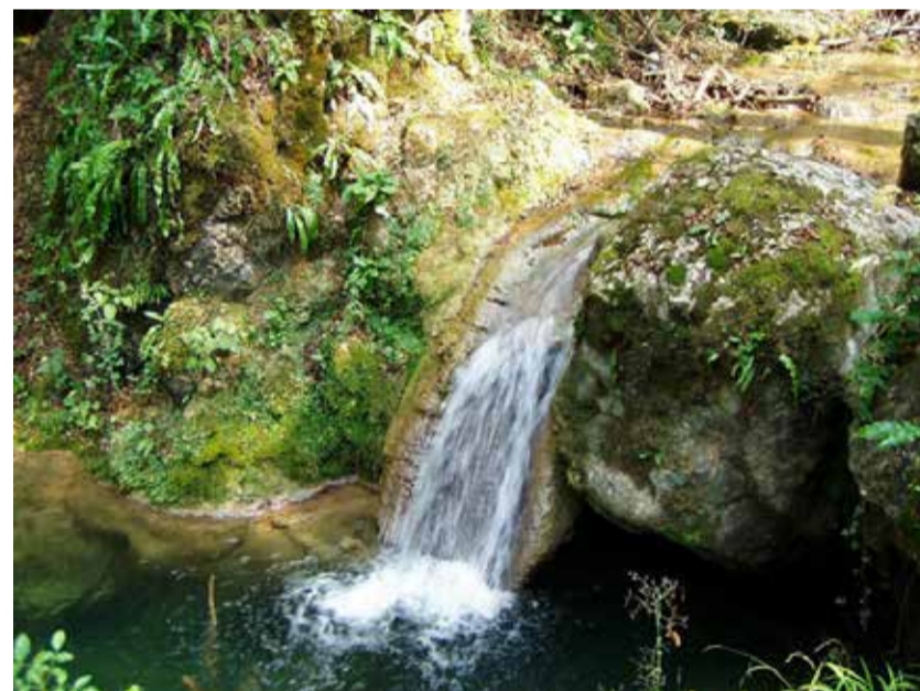
Србија располаже са довољно пијаће воде

Србија у свему овоме нема значајну улогу, али трпи последице.