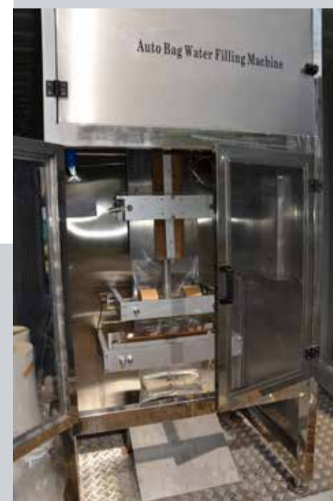
Машина за паковање пречишћене воде у кесе од 3, 5 и 10 литара