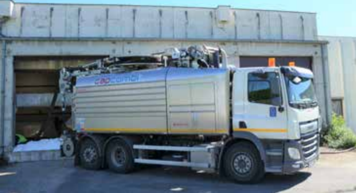
Ново Cappelotto возило надограђено на DAF шасију