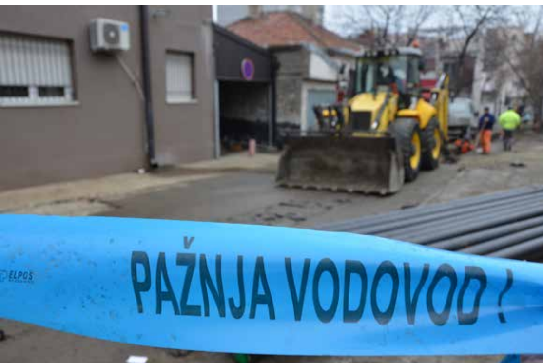
Реконструкције водоводне мреже изводе се широм града