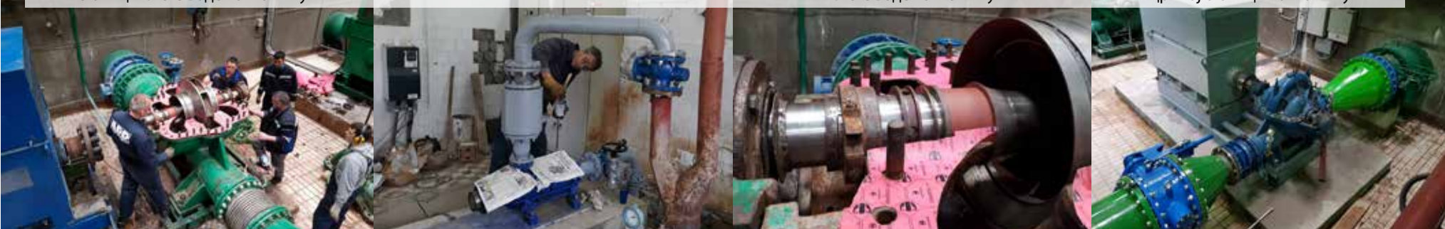
Монтирани нова пумпа и мотор на црпној станици на Макишу