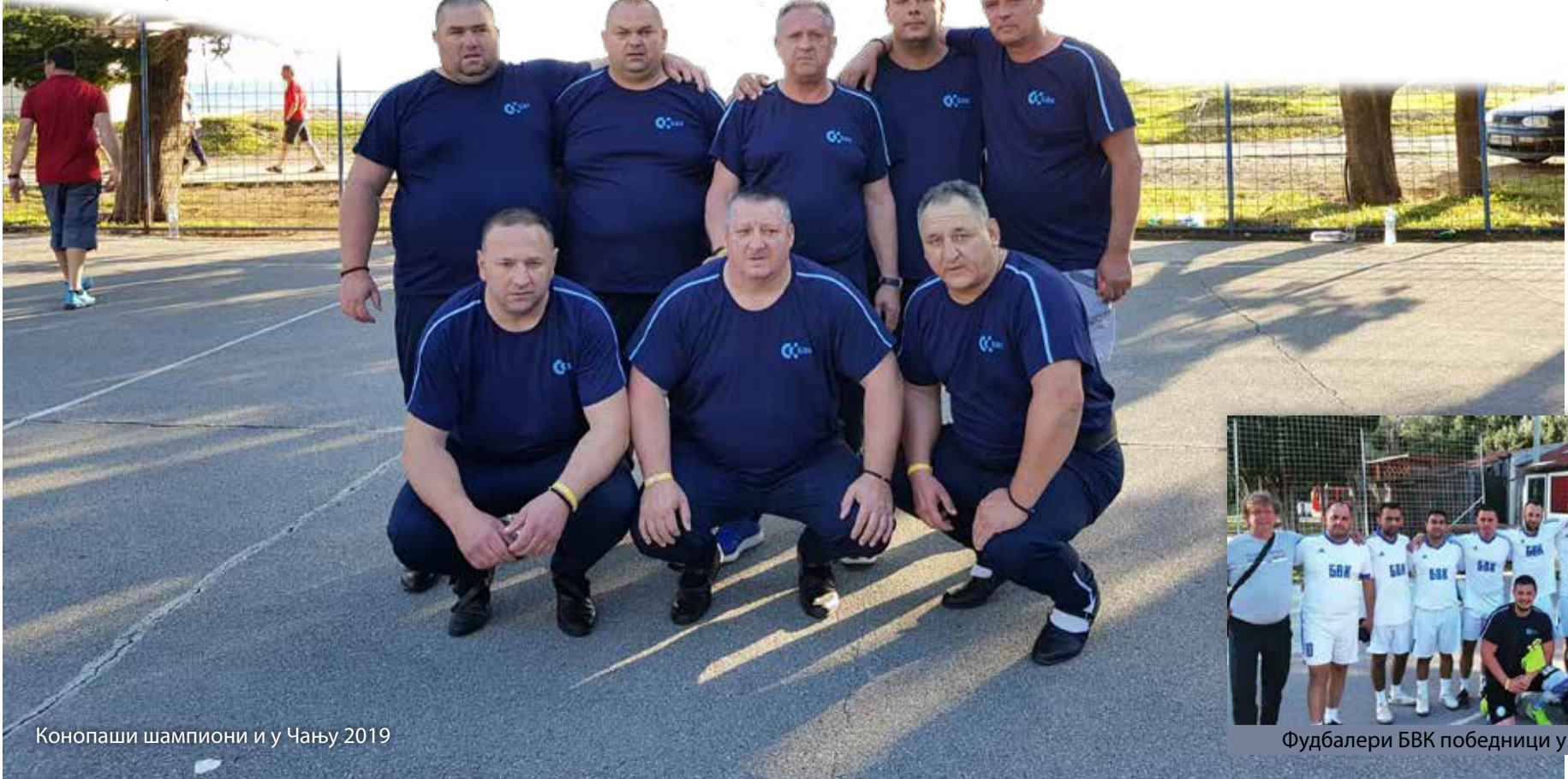
Конопашаи шампиони и у Чању 2019