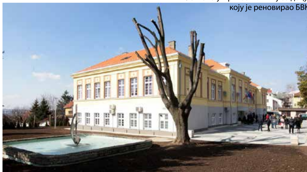
Фонтана у Прихватилишту за децу, коју је реновирао БВК

Београдски водовод и канализација укључили су се у овај хумани пројекат изградњом нове фонтане и обновом кишне канализационе мреже за објекат. Зграда новоотвореног Прихватилишта за децу је најмодернија на Балкану и по свим условима може да се пореди са свим институцијама овог типа у земљама Европске уније.