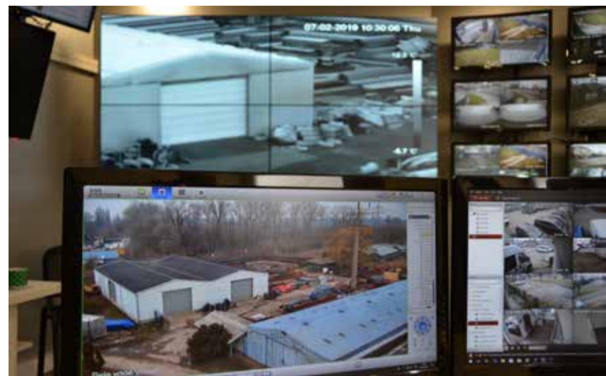
Праћење великог броја локација у сваком тренутку

Са Пионира се иде у контролу видео сегмената и алармних централа. Сервис свих инсталација раде сами због уштеда. Људи који раде у контролно-оперативном центру су обучени за ову врсту посла и имају лиценце за обављање послова техничке заштите, а проверени су и од стране МУП-а.