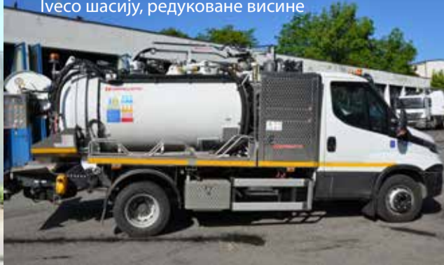
Ново Cappelotto возило надограђено на Iveco шасију, редуковане висине