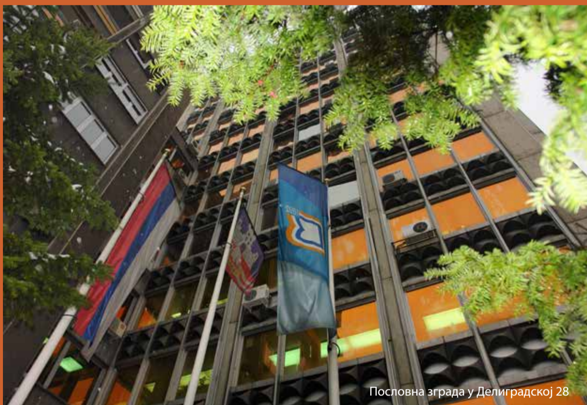
Пословна зграда у Делиградској 28