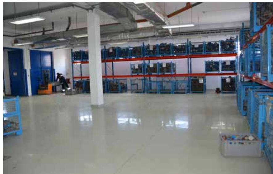
Нови под у Баждарници после радова