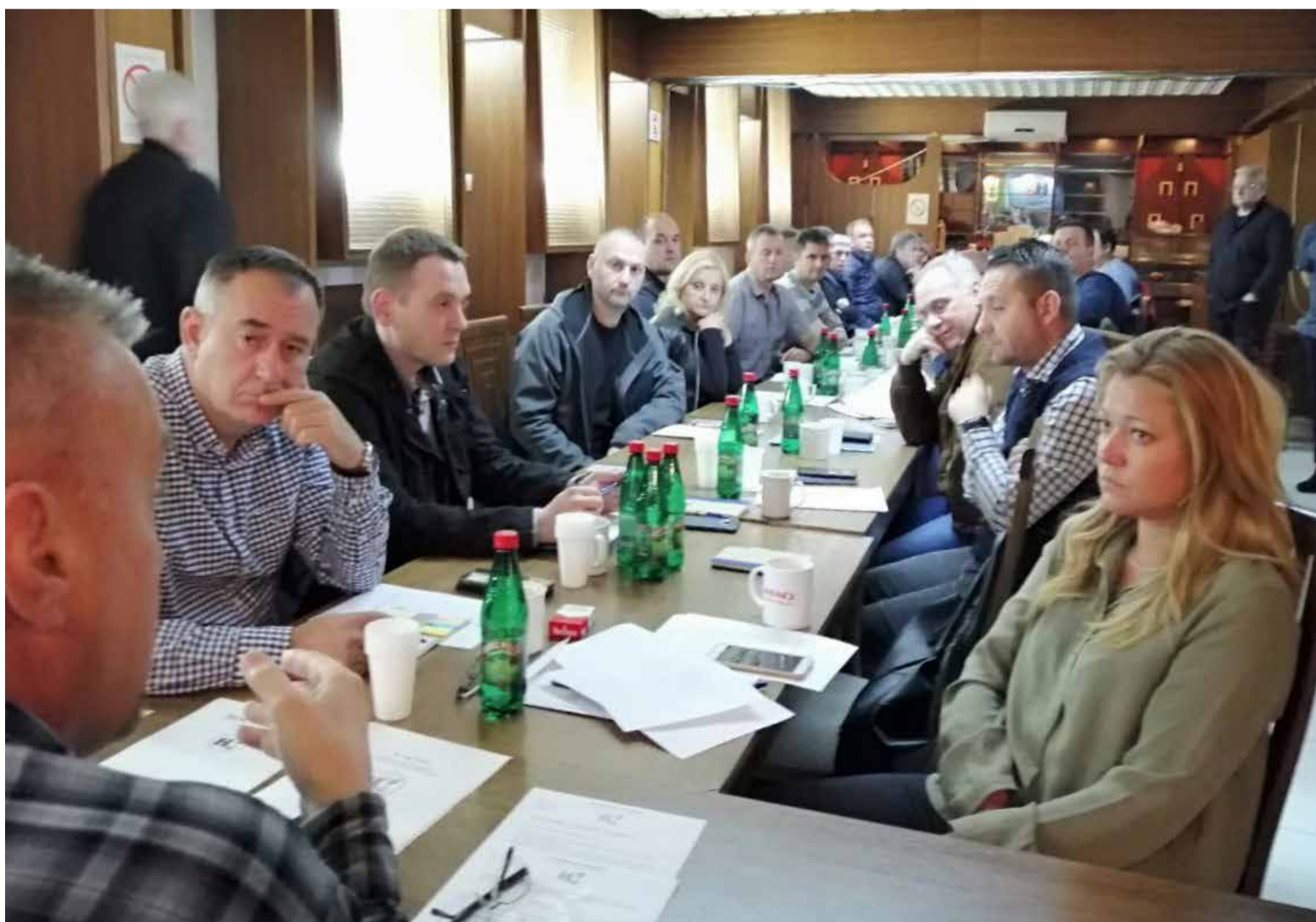
Независни синдикат интензивирао је сарадњу са колегама из других комуналних предузећа

„Позитивни резултати рада нису остали незапажени ни код оних који се са нама не слажу и којима интереси запослених нису на првом месту. У протеклом периоду на рачун синдиката изречена је гомила неистина и злонамерних инсинуација. На њих ћемо најбоље одговорити још бољим и преданијим радом на заштити интереса наших чланова, кроз доследно и непоколебљиво залагање за одбрану и унапређење права запослених“, истичу у Независном синдикату.