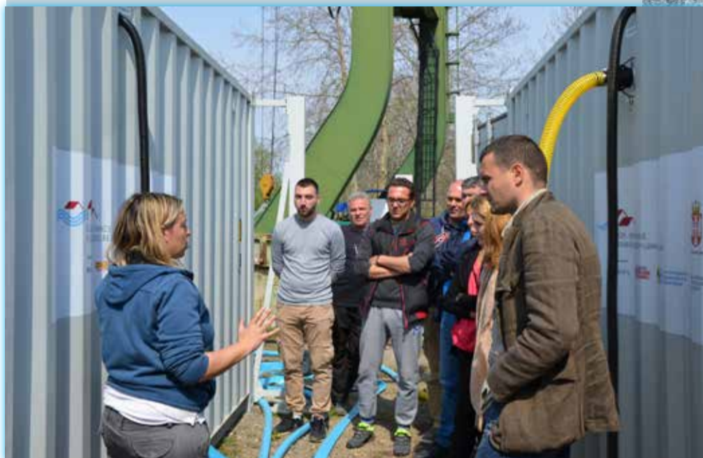
Обука чланова тима БВК је одржана у априлу 2019.