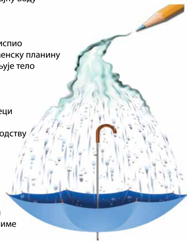
Илустрација: Реке не падају с неба аутор: Александар Жужа

Дунаве водо Видиш ли заверу јесени Месец ми се дави У твојој пени