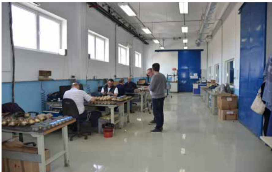
Нови под у сервису водомера у Баждарници

Објект Баждарнице на Погону „Пионир“ изграђен је 2008. године. Подови који су постављени приликом градње објекта, годинама су услед транспорта и тежине водомера, били све више оштећени, што је представљало ризик за раднике и отежавало технолошки процес рада.