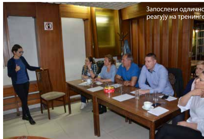
Запослени одлично реагују на тренинге