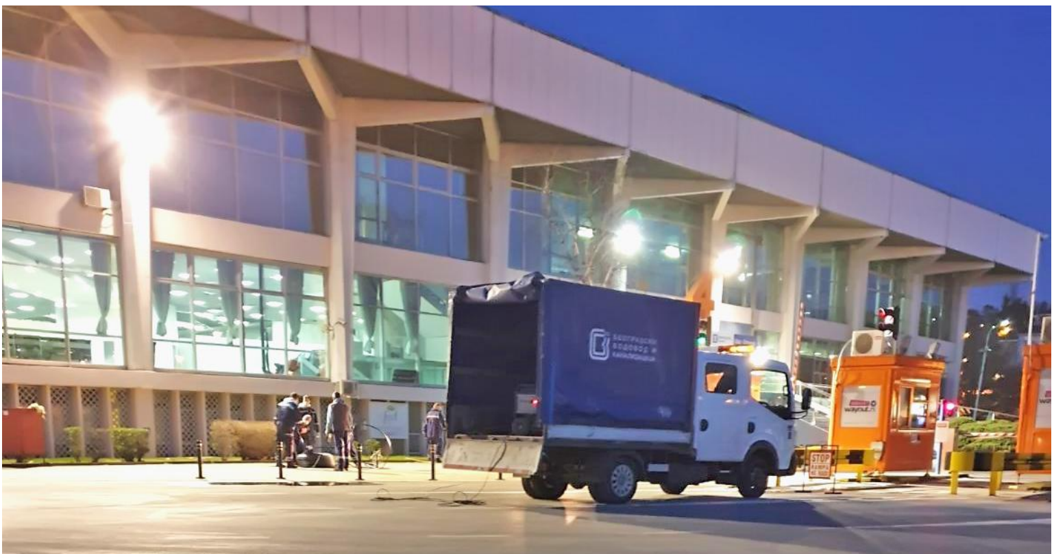
Прикључење санитарних објеката на водоводну и канализациону мрежу на Београдском сајму

Предузеће је почев од 27. марта и током трајања ванредног стања, као и у данима после његовог укидања, за све запослене који су радили у продуженим сменама од 12 и 24 сата организовало доставу оброка, док су запослени уједно остваривали и право на топли оброк кроз обрачун зарада. Дневно је запосленима са продуженим радом достављано 470 оброка. Ова мера донета је због смањења броја контаката запослених у време предвиђено за набавку и одлазак у продавнице и пекаре.