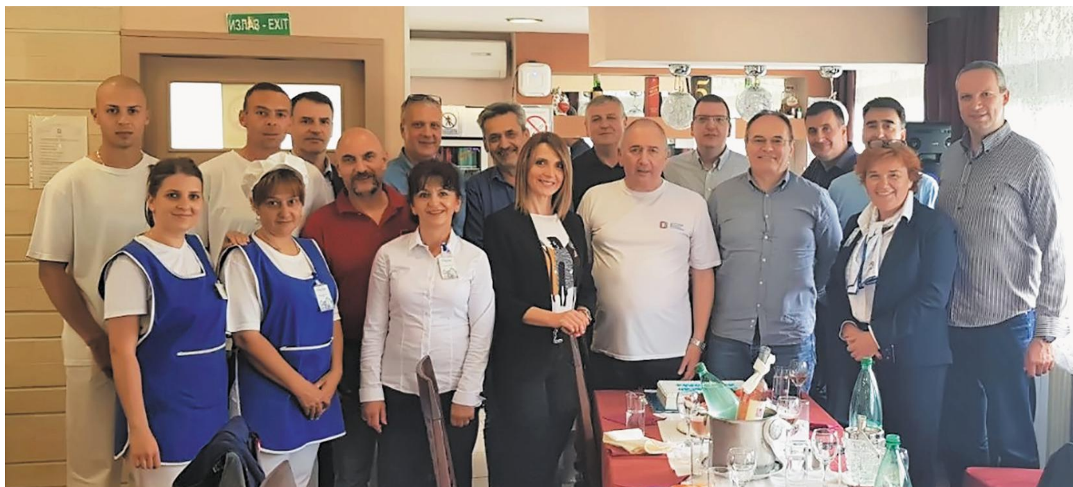
Чланови колегијума директора ЈКП БВК са особљем одмаралишта „Врачар“ дан пре званичног отварања