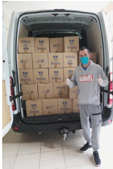
Превоз и испорука градских пакета за најугроженије

Сектор транспорта и механизације ЈКП БВК је за све запослене у минимуму процеса рада обезбедио 170 комби и 140 путничких возила за превоз од куће до посла и назад, како би се смањило оптерећење линија јавног превоза. Што је најважније, на тај начин је смањен број контаката радника са људима изван Предузећа. Поред тога, ангажована су три комби возила са возачима за потребе превоза и испоруке пакета помоћи најугроженијим грађанима на општинама Савски венац и Вождовац и три виљушкар са руковоцима током 12 дана на пословима истовара робе у „Штарк Арени“, такође у хуманитарне сврхе. Обезбедили су превоз и постављање два резервоара са средством за дезинфекцију за потребе грађана, код општине Звездара и спортског центра „Олимп“.