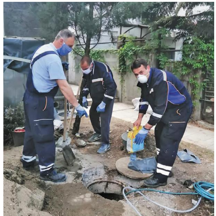
Отклањање дефекта на рејону 4 канализационе мреже

У систему београдске канализације током ванредног стања оперативно је решено 500 позива за интервенције на канализационој мрежи и објектима. Сектор канализационе мреже очистио је приближно 3.000 сливника, одгушено је око 350 сливничких веза и канализационих прикључака, испрано је 8.000 метара канализационе мреже, а извучено је и скоро 200 кубних метара садржаја из колектора.