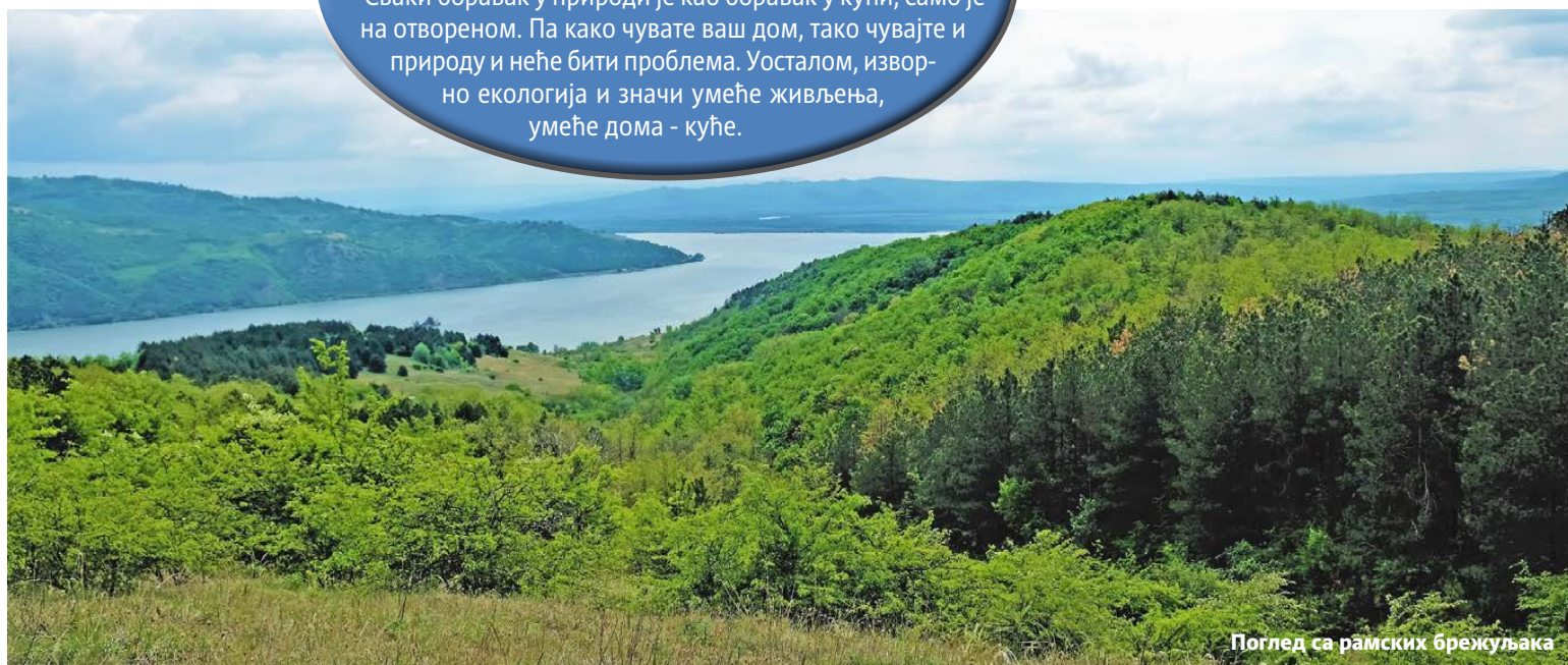
Поглед са рамских брежуљака

Сваки боравак у природи је као боравак у кући, само је на отвореном. Па како чувате ваш дом, тако чувајте и природу и неће бити проблема. Уосталом, изворно екологија и значи умеће живљења, умеће дома - куће.