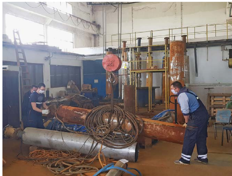
Сарадња погона машинског одржавања и одржавања електро опреме на истом задатку