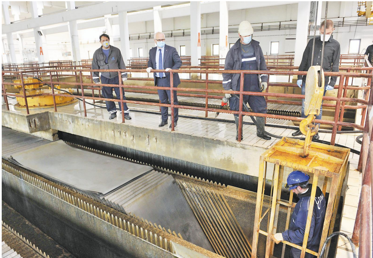
Заменик градоначелника Горан Весић у обиласку погона „Макиш”