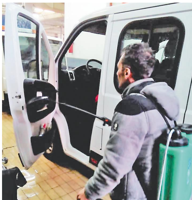
Дезинфекција возила на погону „Душановац“

О томе колико велики посао је завршен говоре и подаци да је за дезинфекцију 10.500 квадратних метара производних погона, преко 19.000 квадратних метара пословних објеката и транспорта укупно утрошено 9.500 литара, а за дезинфекцију саобраћајница 3.500 литара раствора натријум-хипохлорита.