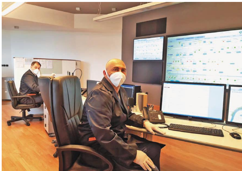
Командно-контролни центар на „Макишу”