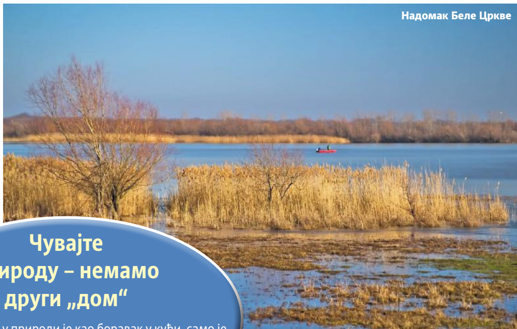
Надамак Беле Цркве

Имам још прегршт предлога и вољан сам да са свим колегиницама и колегама поделим оно што знам. Вама треба само зрнце авантуристичког духа и жеља да видите и доживите Србију, какву нисте никада до сада. Мој умрежени телефон је 064/851-88-38.