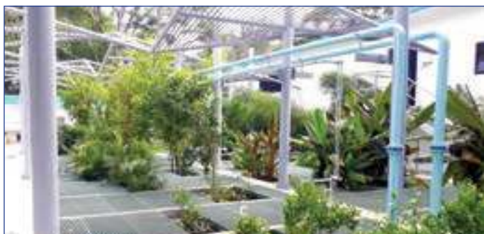
ПРОЕКТОВАНИ ИЗГЛЕД СТАКЛЕНИКА У НАШЕМ ПРЕДУЗЕЋУ