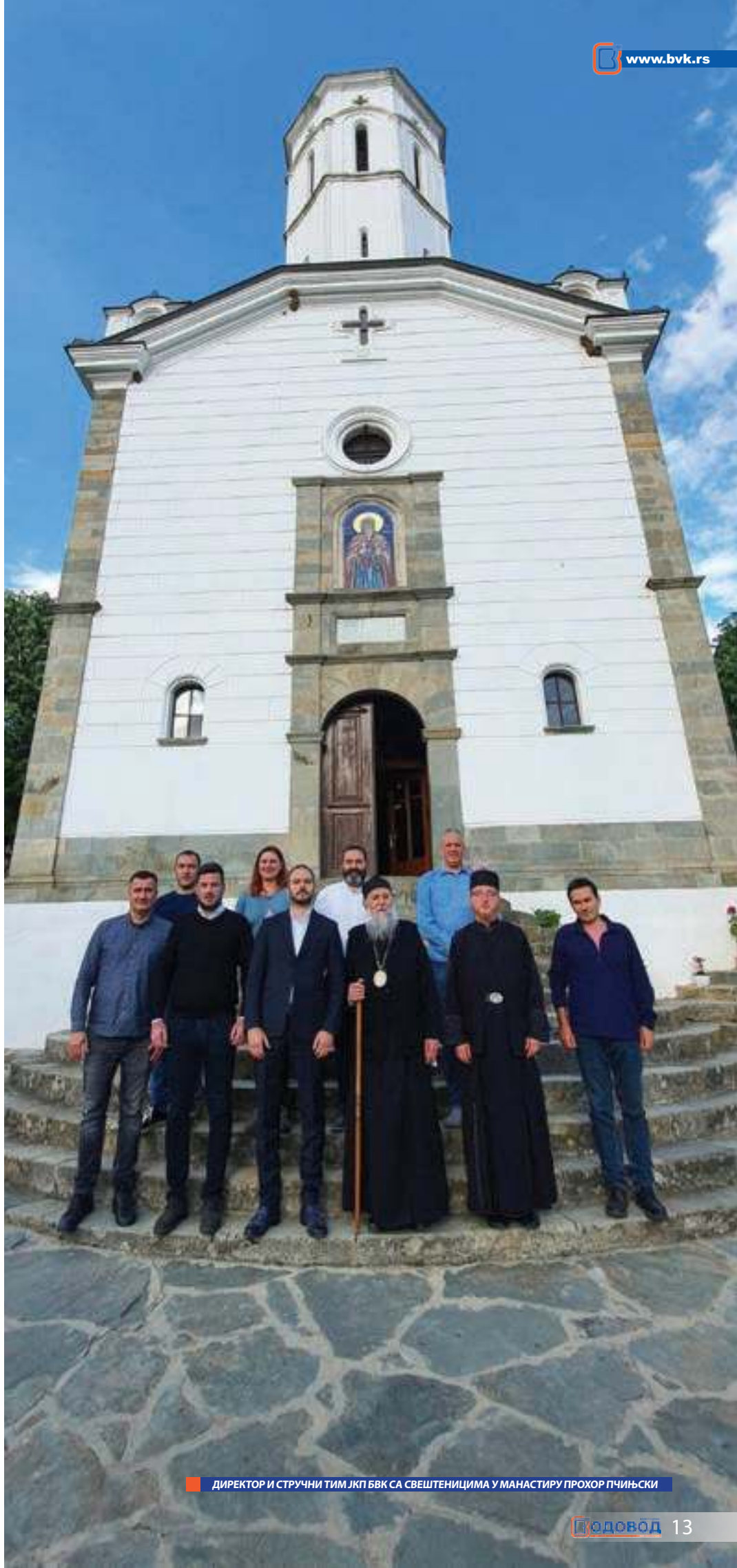
ДИРЕКТОР И СТРУЧНИ ТИМ ЈКП БВК СА СВЕШТЕНИЦИМА У МОНАСТИРУ ПРОХОР ПЧИЊСКИ