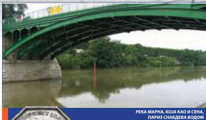
РЕКА МАРНА, КОЈА КАО И СЕНА, ПАРИЗ СНАБДЕВА ВОДОМ

и пуцање цеви и обезбеђује добро снабдевање грађана пијаћом водом.