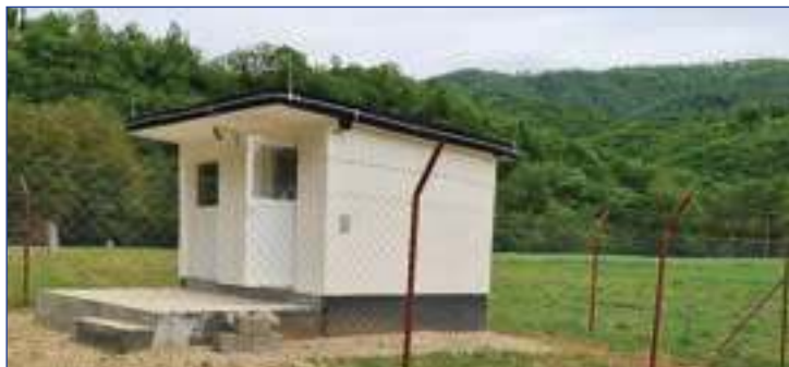
НОВОИЗГРАЂЕНИ ОБЈЕКАТ ЗА АУТОМАТИКУ И ЕЛЕКТРООПРЕМУ У МАНАСТИРУ

Поред свих свакодневних и периодичних послова које обављамо, сматрајући да имамо обавезу према нашој верској и културној баштини, овога пута издвојена су додатна средства и потребно време, како би била обезбеђена најважнија животна намирница за један од наших историјски најважнијих и најстаријих манастира, подигнутог у XI веку, као и за добробит околног становништва.