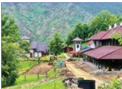
РАДОВИ У МОНАСТИРСКОМ КОМПЛЕКСУ

Посебан значај Светог оца Прохора је у томе што он мироточи - из његових светих моштију тече свето миро којим се помазују наши верници који долазе и траже његову помоћ и који се њему обраћају за исцељење у болестима и невољама. Манастир Светог Прохора Пчињског доста је страдао, али је такође и обнављан.