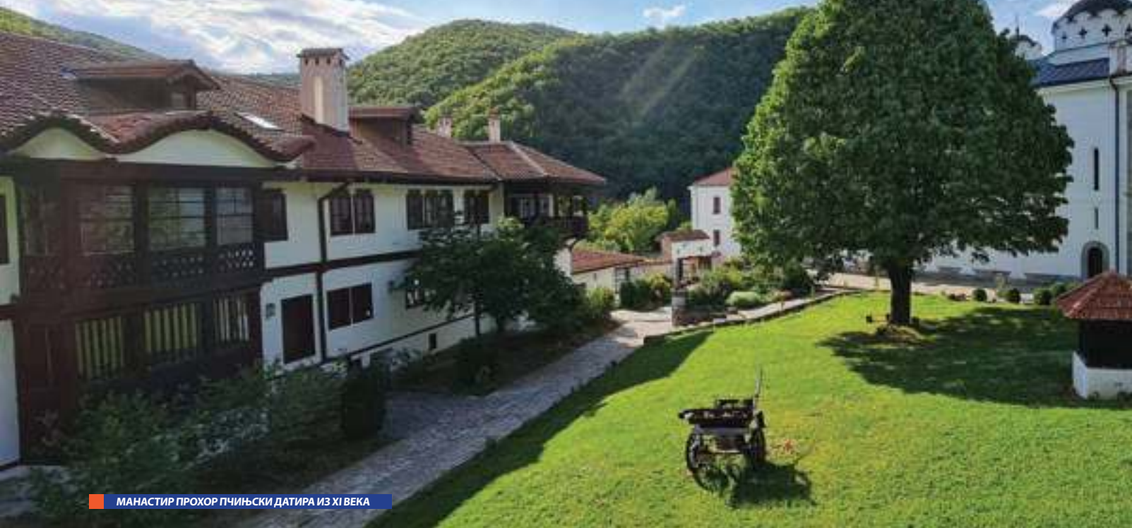
МАНАСТИР ПРОХОР ПЧИЊСКИ ДАТИРА ИЗ XI ВЕКА