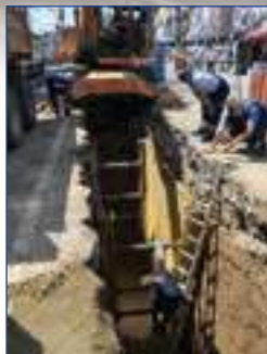
ЗАХТЕВНИ РАДОВИ И ЗБОГ ВЕЛИКЕ ДУБИНЕ РОВОВА