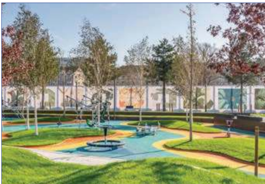
ЦЕНТРАЛ ПАРК У БЕОГРАДУ НА ВОДИ