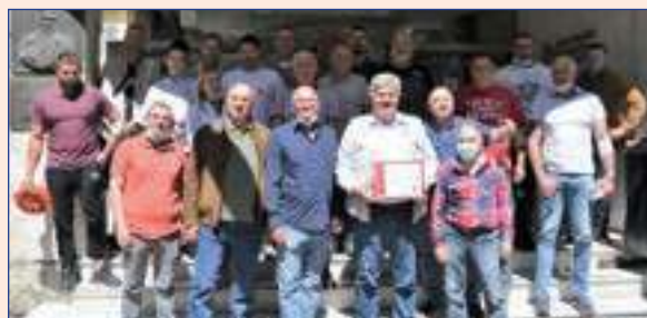
ДОБРОВОЉНИ ДАВАОЦИ КРВИ ЗАЈЕДНО СА МЕДИЦИНСКИМ ОСОБЉЕМ ИЗ ИНСТИТУТА ЗА ТРАНСФУЗИЈУ КРВИ СРБИЈЕ