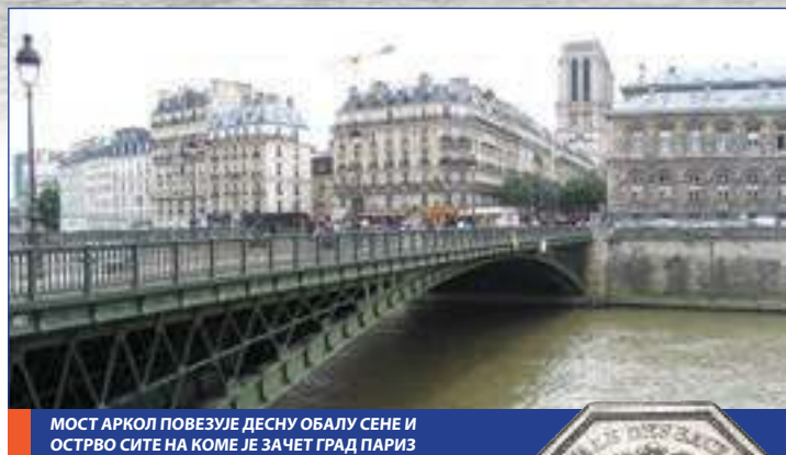
МОСТ АРКОЛ ПОВЕЗУЈЕ ДЕСНУ ОБАЛУ СЕНЕ И ОСТРВО СИТЕ НА КОМЕ ЈЕ ЗАЧЕТ ГРАД ПАРИЗ