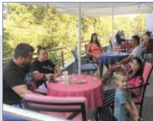
ОДМОР У ПРИЈАТНОМ ОКРУЖЕЊУ НА ТЕРАСИ ОДМАРАЛИШТА