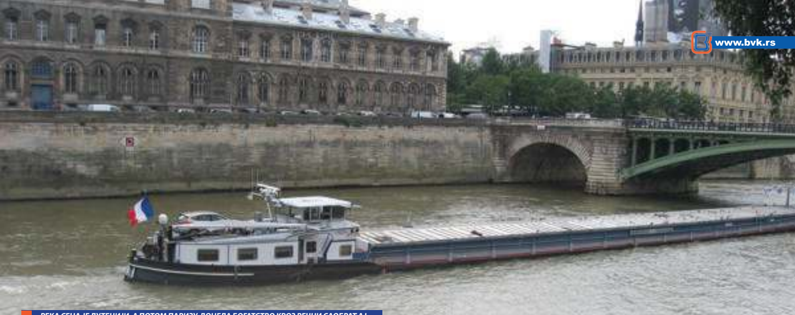
РЕКА СЕНА ЈЕ ЛУТЕЦИЈИ, А ПОТОМ ПАРИЗУ, ДОНЕЛА БОГАТСТВО КРОЗ РЕЧНИ САОБРАЋАЈ