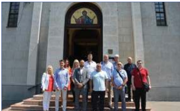
ПРЕДСТАВНИЦИ РУКОВОДСТВА И СИНДИКАТА ИСПРЕД ВАЗНЕСЕЊСКЕ ЦРКВЕ НА ПЕТРОВДАН 2021.

Ове године слава Свети апостоли Петар и Павле и 129. годишњица Предузећа обележени су скромно, због и даље актуелне епидемиолошке ситуације у граду.