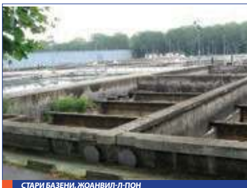
СТАРИ БАЗЕНИ, ЖОАНВИЛ-Л-ПОН

Поред тога, предузеће Вода Париза има и програм биолошке конверзије за пољопривредна подручја смештена у пумпним регијама, како би се побољшао почетни квалитет сирове воде и ограничио обим убризганих третмана.