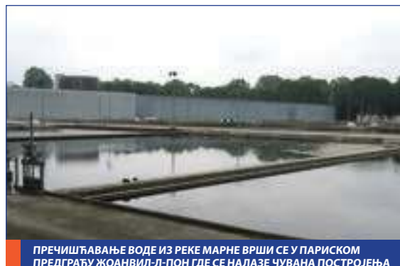
ПРЕЧИШЋАВАЊЕ ВОДЕ ИЗ РЕКЕ МАРНЕ ВРШИ СЕ У ПАРИСКОМ ПРЕДГРАЂУ ЖОАНВИЛ-Л-ПОН ГДЕ СЕ НАЛАЗЕ ЧУВАНА ПОСТРОЈЕЊА