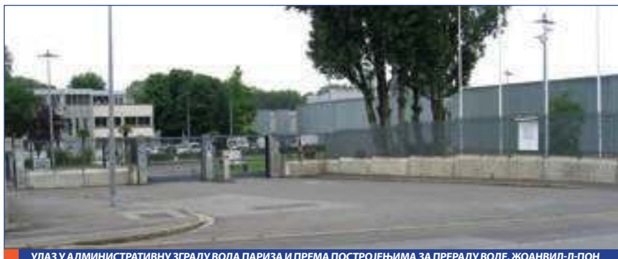
УЛАЗ У АДМИНИСТРАТИВНУ ЗГРАДУ ВОДА ПАРИЗА И ПРЕМА ПОСТРОЈЕЊИМА ЗА ПЕРЕДУ ВОДЕ, ЖОАНВИЛ-Л-ПОН

Одржаване и побољшане структуре из 19. века и даље испоручују пијаћу воду Паризу у 21. веку. Изграђени између 1870. и 1925. године, аквадукти се редовно одржавају и прати се њихово унутрашње и спољашње стање. Интервенцијама предузећа Вода Париза спречава се цурење