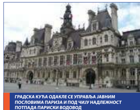
ГРАДСКА КУЋА ОДАКЛЕ СЕ УПРАВЉА ЈАВНИМ ПОСЛОВИМА ПАРИЗА И ПОД ЧИЛУ НАДЛЕЖНОСТ ПОТПАДА ПАРИСКИ ВОДОВОД