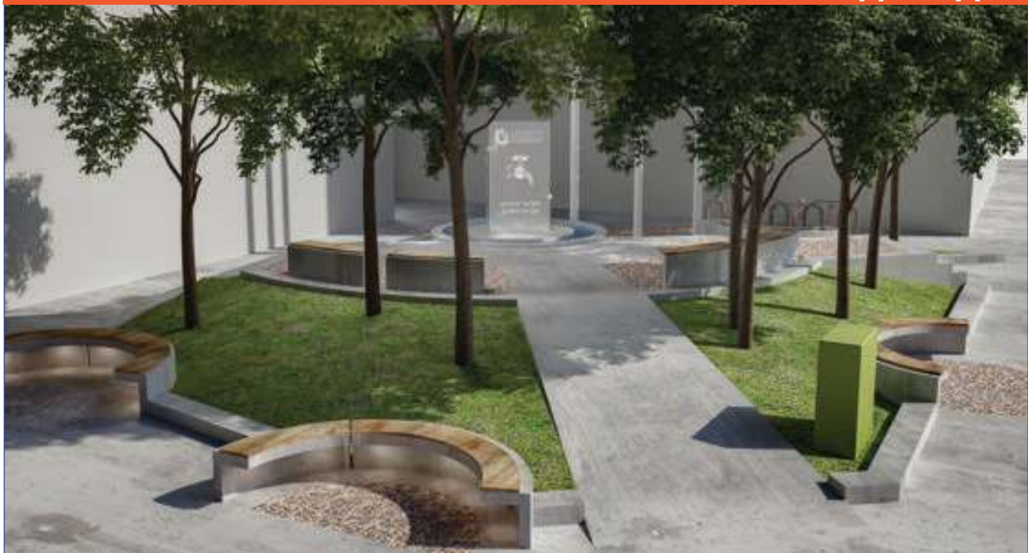
ПРОЕКТОВАНИ ИЗГЛЕД ПАРКА ПОРЕД УЛАЗА У ОБЈЕКАТ БВК У ДЕЛИГРАДСКОЈ