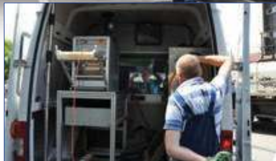
КАМЕРМАНИ СУ СНИМАЛИ СТАЊЕ КАНАЛИЗАЦИОНЕ МРЕЖЕ И ДОПРИНЕЛИ БРЖЕМ ОТКЛАЊАЊУ КВАРОВА