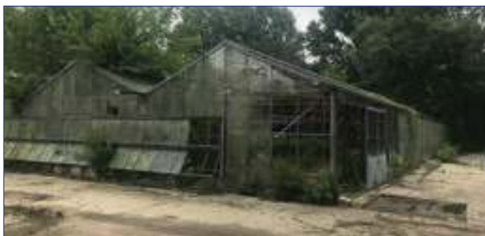
ПОСТОЈЕЋИ СТАКЛЕНИК НА ПОГОНУ МАКИШ

намене. Биће урађена анализа и план уређења и озелењавања површина БВК за дужи временски период због обезбеђивања инвестиција. Део плана је и уређење платоа поред зграде, терасе на 13. спрату и улазног дела у наш пословни објект у Делиградској улици.