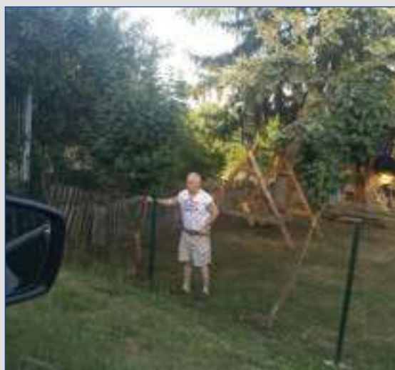
СТАНОВНИК БАРАЈЕВА ЗАЛИВА ТРАВЊАК ПОРЕД МОЛБЕ ДА СЕ РАЦИОНАЛНО КОРИСТИ ВОДА СА ЧЕСМЕ