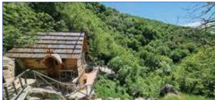
КОМПЛЕКС МАНАСТИРА БОГАТ ЈЕ ВЕРСКИМ ОБЈЕКТИМА У ПРИРОДНОМ ОКРУЖЕЊУ